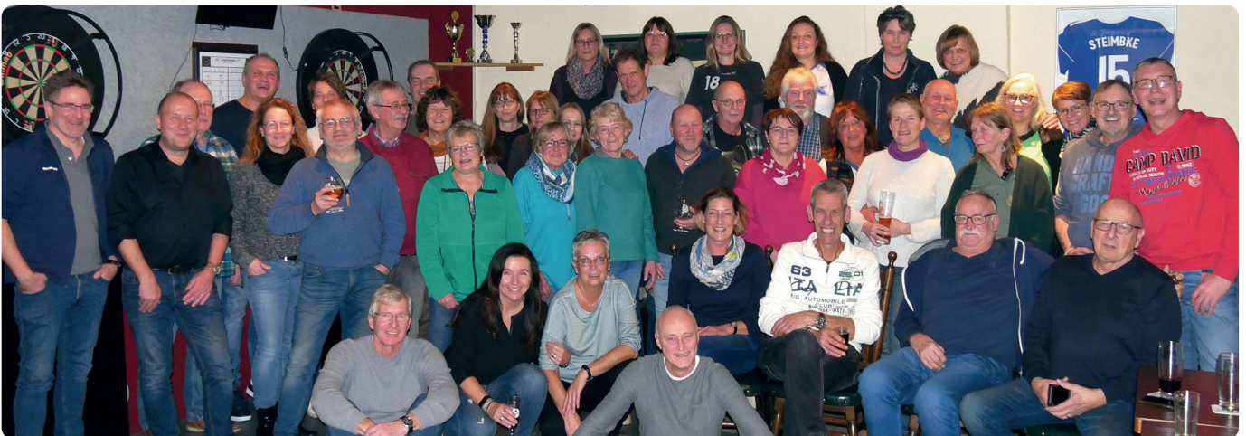
Das obligatorische Gruppenfoto beim Ehemaligentreffen durfte natürlich nicht fehlen