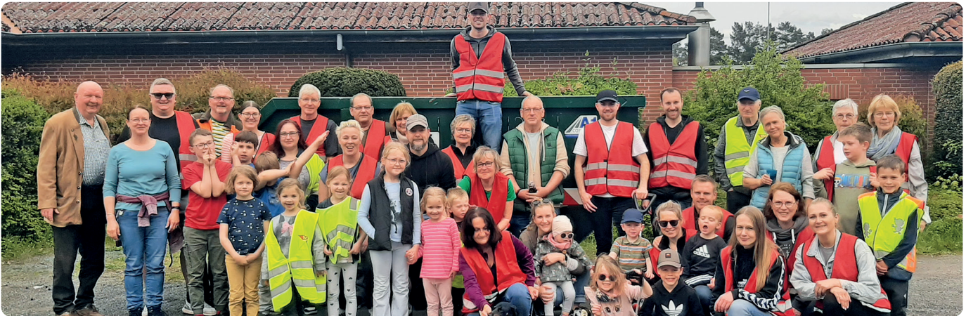
Die Teilnehmerinnen und Teilnehmer bei der diesjährigen Müllsammelaktion in unserem Ort