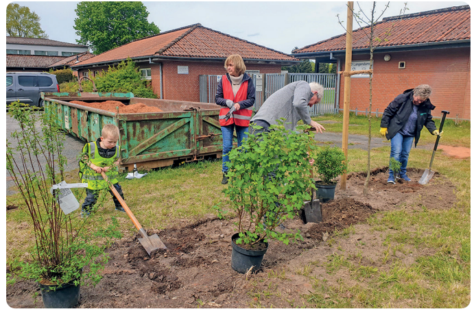
Auch die Jüngsten konnten beim Einpflanzen der Büsche die Älteren tatkräftig unterstützen