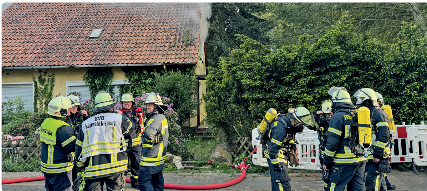
Während ein Trupp mit den Löscharbeiten im Gebäudeinneren beschäftigt war, standen Einsatzkräfte mit Atemschutz in Bereitschaft und die Führungskräfte besprachen das weitere Vorgehen Text und Foto: Henkel

Einsatzkräfte konnten den Brand schnell löschen