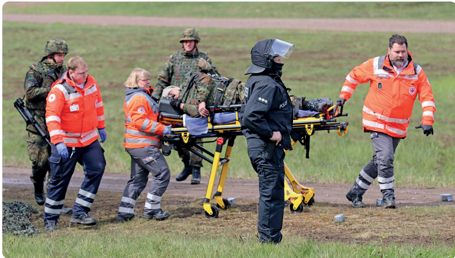
Musterbeispiele der zivilmilitärischen Zusammenarbeit waren bei der Heimatschutzübung auf dem Standortübungsplatz in Langendamm zu sehen

Die Soldatinnen und Soldaten arbeiteten dabei mit zivilen Rettungs- und Einsatzkräften des Deutschen Roten Kreuzes, des Technischen Hilfswerks und der Bereitschaftspolizei zusammen. Den Höhepunkt bildete ein Besuchertag am 25.