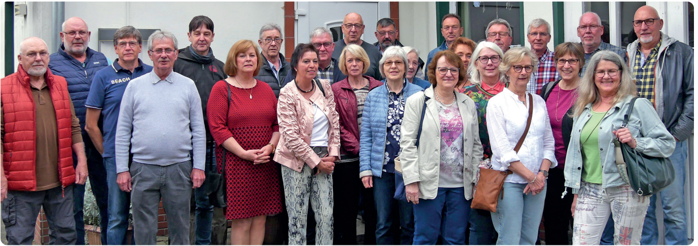
Die ehemaligen Volksschülerinnen und -schüler aus Langendamm beim Jubiläumstreffen 2024...

Ehemalige Volksschüler feiern Jubiläum des Schulabschlusses