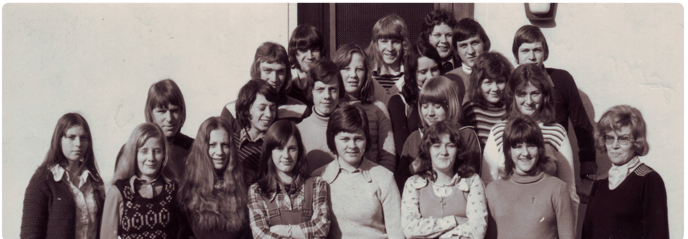
...und bei Ihrem Abschluss im Jahr 1974 vor dem Schulgebäude

Und so gab es noch viele weitere Erzählungen in einer gemütlichen und heiteren Runde, bis man sich mit dem Ziel verabschiedete, bis zum nächsten Klassentreffen nicht zu viel Zeit vergehen zu lassen!