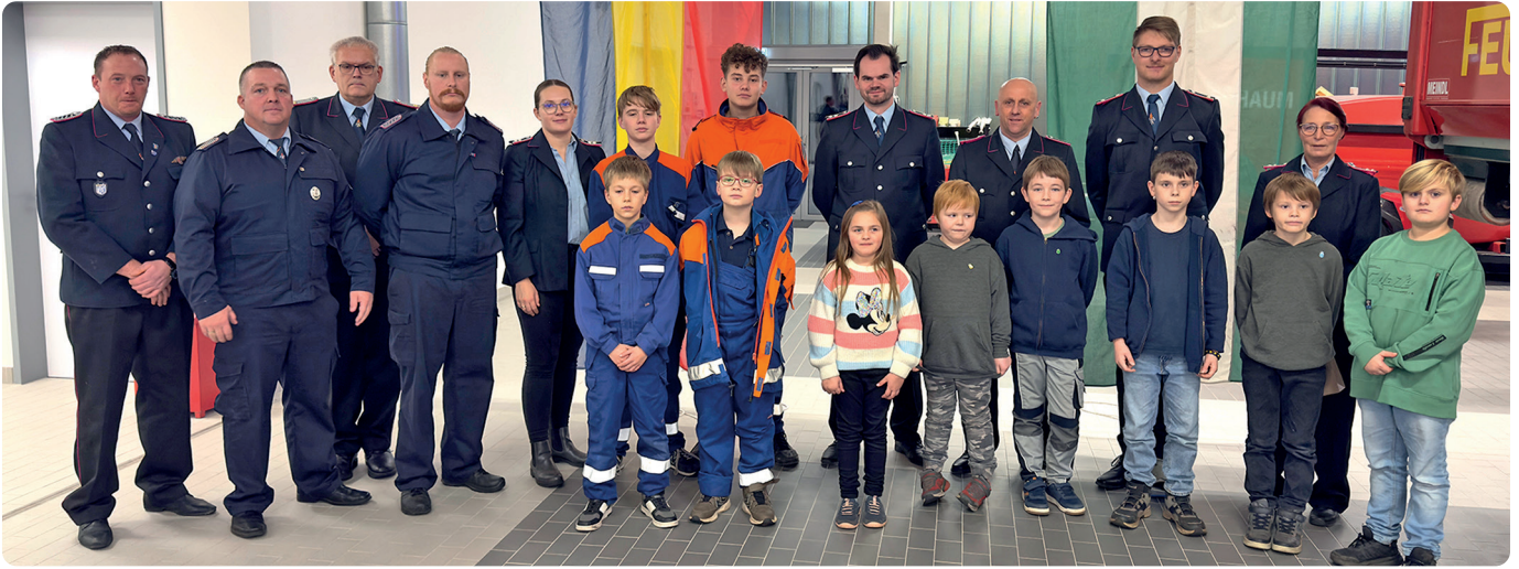
Die neugewählten, verabschiedeten und geehrten Mitglieder der Kinder- und Jugendfeuerwehr Langendamm mit Gästen

Mitgliederwerbung soll in 2026 forciert werden