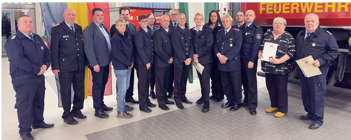
Die geehrten, beförderten und ausgezeichneten Mitglieder der Freiwilligen Feuerwehr Langendamm mit Gästen

Gerätewarte geben nach über 30 Jahren ihre Ämter in jüngere Hände