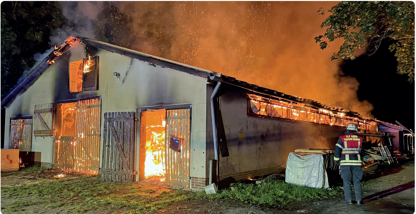
Bereits beim Eintreffen der ersten Einsatzkräfte konnte die Lagerhalle nicht mehr gerettet werden

Wasserversorgung bereitete Probleme - Über 70 Feuerwehrleute im Einsatz