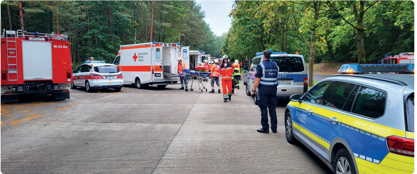
Zahlreiche Einsatzkräfte von Polizei, Rettungsdienst und Feuerwehr waren in die Übung eingebunden

Gemeinsame Sache der Polizeidirektion Göttingen mit dem Landkreis