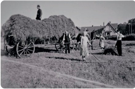
Bäuerliche Familie bei der Heuernte Anfang des 20. Jahrhunderts in Langendamm