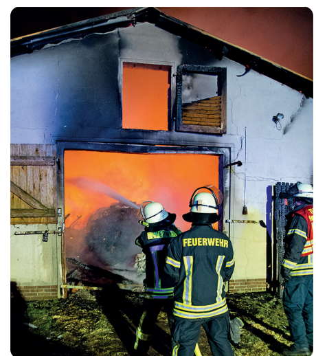
Die Einsatzkräfte konnten nur von außerhalb den Brand effektiv bekämpfen

Warum es zu dem Brand gekommen ist, werden ggf. die Ermittlungen der Polizei ergeben. Zur Schadenshöhe kann derzeit keine Aussage getätigt werden.