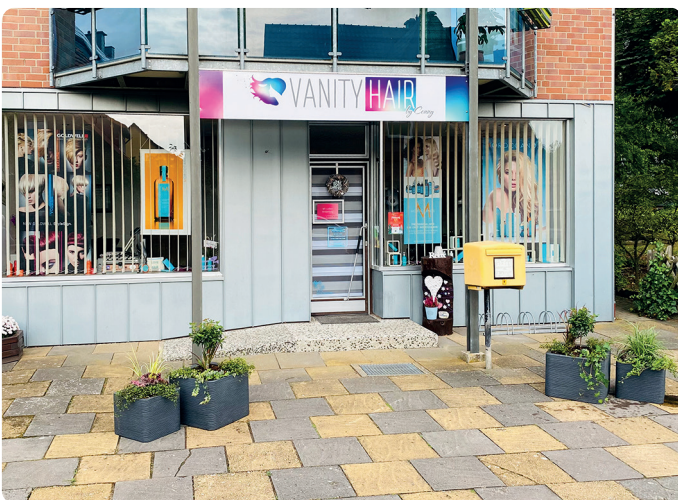
Der liebevoll eingerichtete Eingangsbereich des neuen Friseursalons an der Breslauer Straße

Mit einem Blumenstrauß haben beide Frau Kuper im Namen des Ortsrates willkommen geheißt!