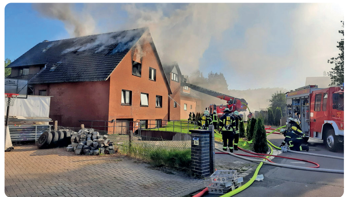
Im ersten Obergeschoss brach das Feuer aus und erfasste auch das Dach des Gebäudes