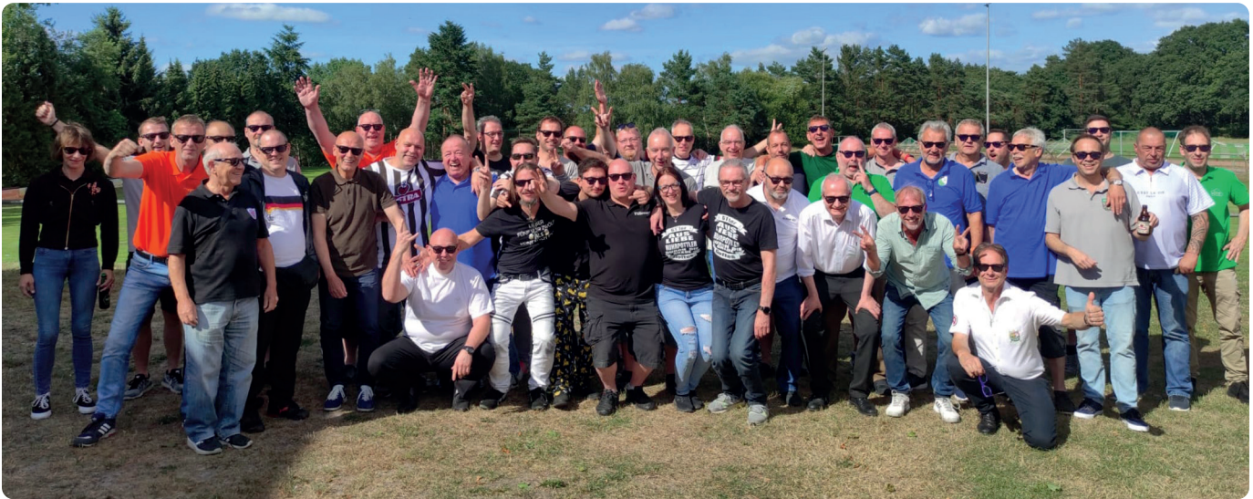
Die Teilnehmer aus der ganzen Bundesrepublik beim abschließenden Gruppenfoto

Billardspieler aus ganz Deutschland in Langendamm zu Gast