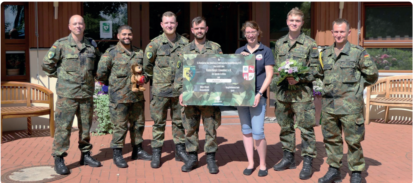
Die stolze Summe von 1.000 Euro geht in die Hände des Vereins Löwenherz über