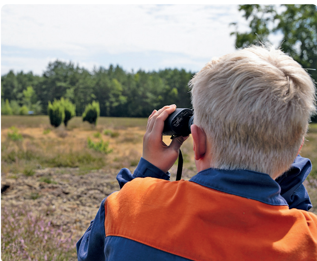
Mit dem Fernglas erkennen und benennen, was in 150m Entfernung abgebildet ist, war eine der Aufgaben an den Stationen

Nach dem Frühstück ging es am Freitag nach Wietzen zum Bauerngolf. Hier war die Aufgabe, wie beim "echten" Golf, mit gekonnten Schlägen den Ball in die Löcher zu befördern. Hier jedoch waren die Schläger und die Bälle weitaus größer. Das Überdimensionale machte allen Jugendfeuerwehrmitgliedern riesig Spaß und sorgte für Heiterkeit. Nachdem alle aus Wietzen zurückgekehrt waren, stand