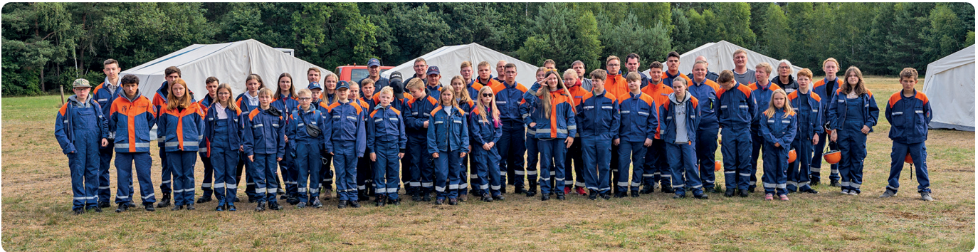
Die Teilnehmer des Stadtjugendfeuerwehrlagers vor ihren aufgebauten Zelten

Stadtjugendfeuerwehrlager in Langendamm ausgerichtet