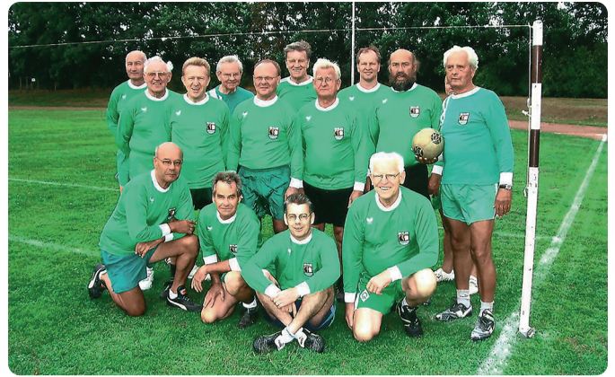
Auf dem linken Bild sind die SCB-Faustballer im März 2012 zu sehen, rechts eine Aufnahme Ende der 1980er-Jahre